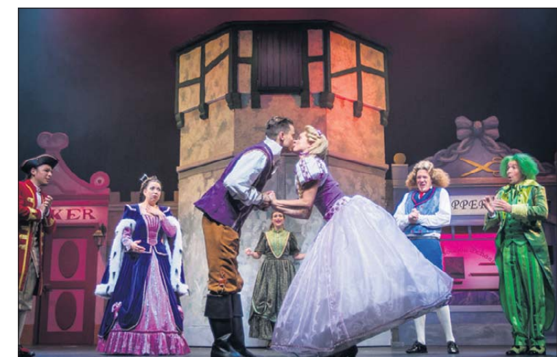
Scène uit 'Rapunzel'.